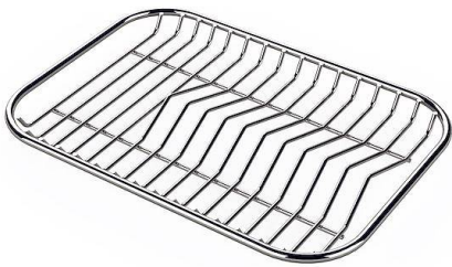
Tellerständer aus Edelstahl 8100 154