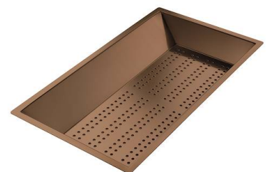
Perforierte Edelstahlwanne PVD Copper 8151 008