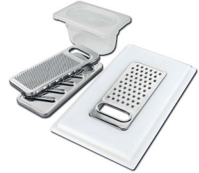
Satz Reibe mit Halterung für Ring und Auffangschale