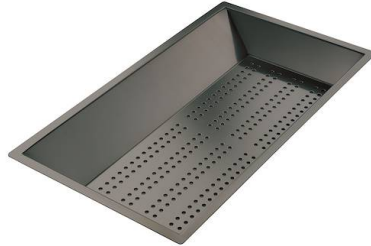
Perforierte Edelstahlwanne PVD Gun Metal