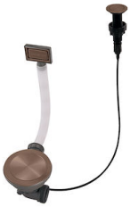
Automatischer Abfluss Space Push Copper