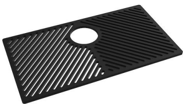
Griglia Black 8100 653